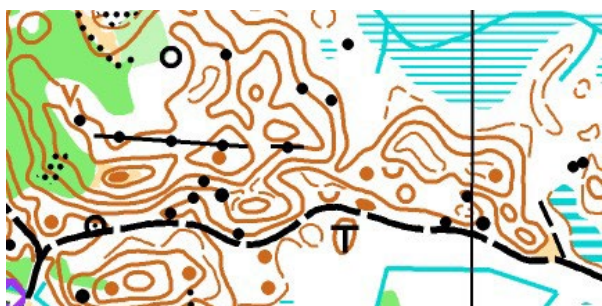
Efter.... den nya kartan

Under.... den höjdkurvsbild jag har som grund. Sedan finns andra underlag som jag kompletterar ifrån. Bland annat vägar, växtlighet.