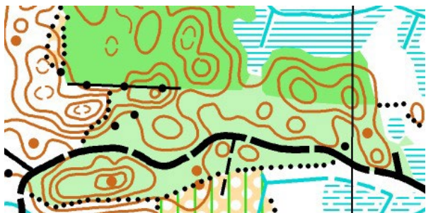
Före.... den gamla kartan.

Jag tänkte visa före – under – efter kartritning på ett specifikt område så ni kan jämföra.